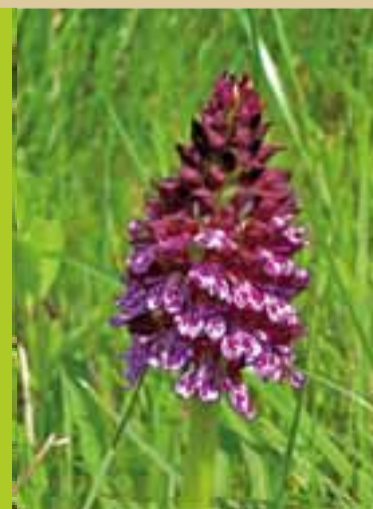
Cenne piepère

Notre territoire présente plusieurs types de dispositifs de protection des espèces animales et végétales, témoins de ses richesses naturelles. En plus de nombreuses ZNIEFF (Zones Naturelles d'Intérêt Ecologique, Faunistique et Floristique), deux sites NATURA 2000 visent la préservation de la diversité biologique : le site « Piège et Collines du Lauragais » pour la conservation des oiseaux (26 espèces concernées), le site « Massif de la Malepère » pour la préservation d'espèces de chauves-souris et d'orchidées.