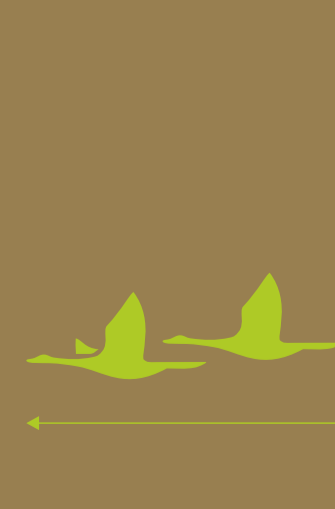
Buzard Saint-Martin