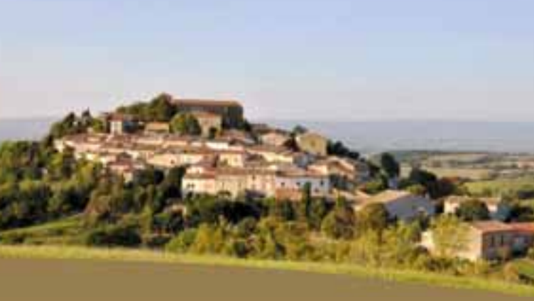
Lauragais - Grand