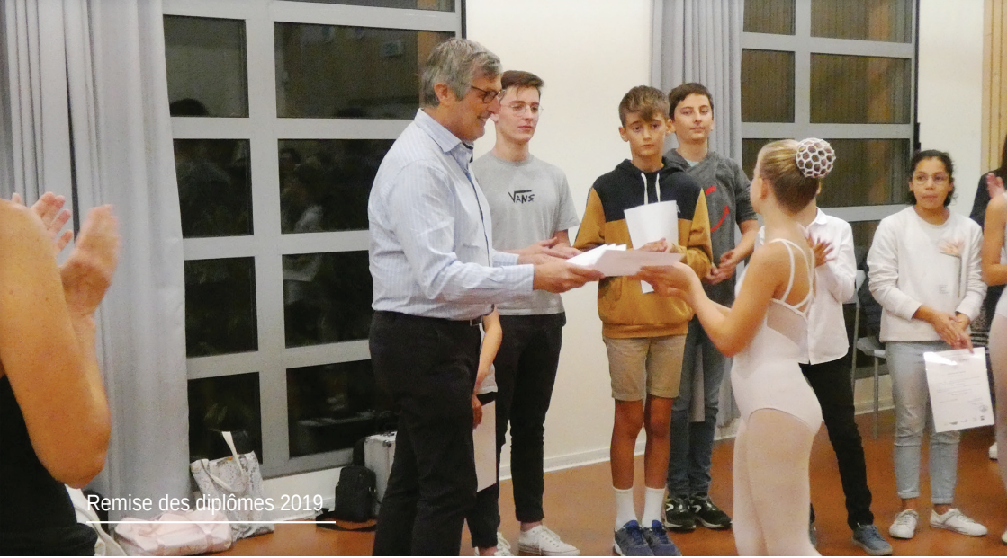
Remise des diplômes 2019