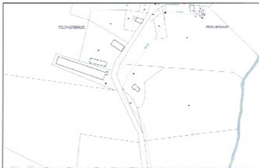
Figure 1 : Plan du réseau d’eau potable